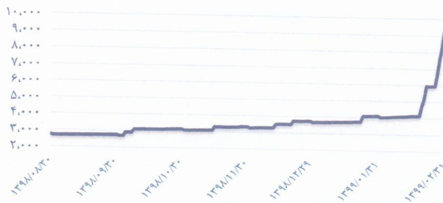
تغییرات خالص ارزش دارایی‌های صندوق آسمان امید در تاریخ ۱۳۹۹/۰۲/۳۱ (میلیارد ریال)

خالص ارزش دارایی‌های صندوق از ابتدای سال مالی تا ۳۱ اردیبهشت‌ماه سال ۱۳۹۹ حدود ۲۵۷ درصد رشد کرده و به رقم ۹۶,۰۶ میلیارد ریال رسیده است.